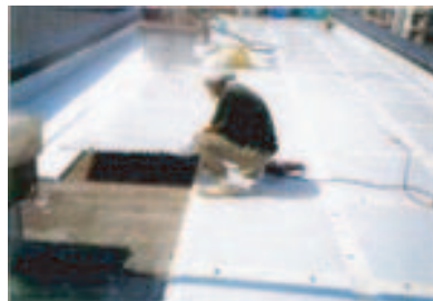
2. テクノパネル敷きこみ