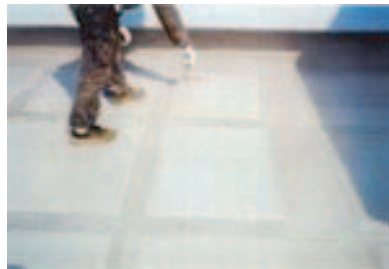
5. 平場・AトップTK塗布