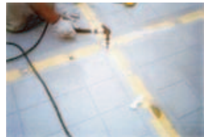
3. パネル固定・アンカー打ち込み