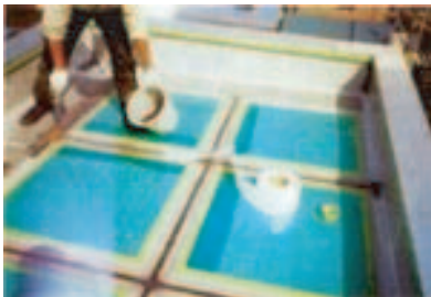
4. パネルジョイント部・FRPライニング